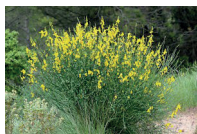
le genêt d'Espagne