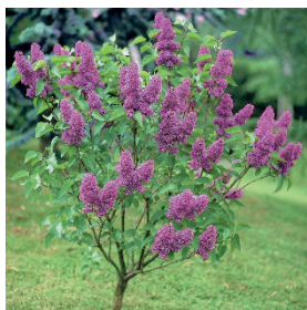
le Lilas commun

Vous pouvez envisager des arbustes greffés sur tiges (inférieur à 3 mètres de haut), idéal lorsque plantés à proximité d'une habitation. Par exemple : Salix integra 'Hakuro Nishiki', un saule crevette, ou encore Ligustrum jonandrum un troène sur tige.